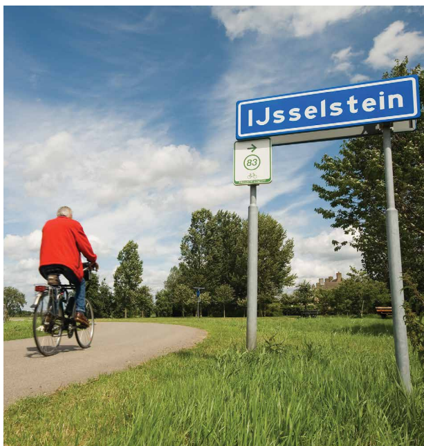
De wijkatlassen geven inzicht in de vier wijken van IJsselstein

Meer weten over de wijkatlas of het wijkprogramma van uw wijk? Ga naar de website www.onsijsselstein.nl