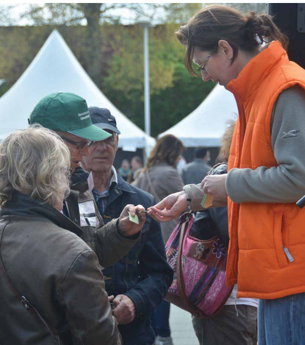
Samenwerken aan activiteiten in de wijk

Bent of wilt u een betrokken bewoner worden in de wijk en weet u niet altijd de andere bewoner te bereiken of andere bewoners te enthousiasmeren om iets voor de wijk te betekenen? Kom dan naar de workshop 'interactie met wijkbewoners' op donderdag 19 juni a.s. om 19.30 uur in de Sterrenwacht, Marinus Vermeerplein 1 (achter de Clinckhoeff).