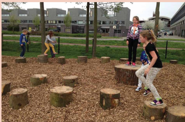
Plezierig spelen op natuurlijke materialen

Bewonersgroep Actief Zenderpark, organisator wijkspeldag Zenderpark