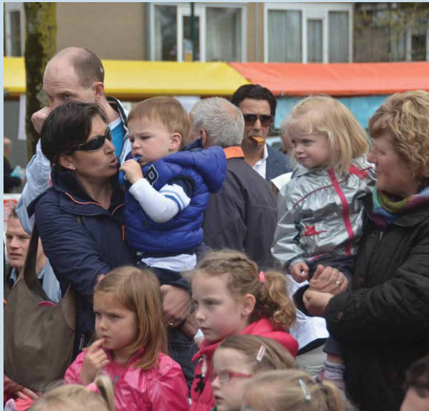
Ouders en kinderen tijdens de vrijmarkt op 13 april

De bewonersgroep is rustig aan het opstarten zodat zij zich straks volledig en met plezier kunnen inzetten voor de wijk. Daarnaast is er naast de website van Onsijselstein.nl nu ook een eigen website www.ijsselstein-noord.nl/ijsselveld-oost , bedoeld voor alle nieuws uit de wijk. De bewonersgroep is te bereiken via bewonersgroep.ijsselveldoost@gmail.com